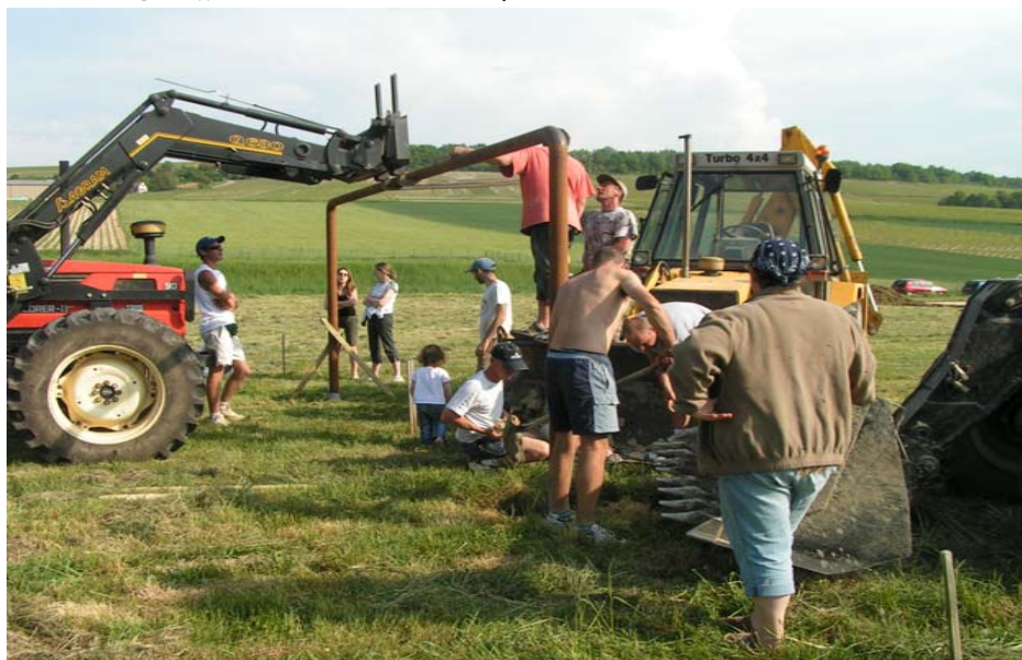
Aménagement du terrain de pétanque

Délimitation du terrain de foot et installation des buts