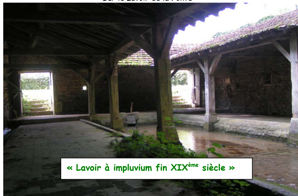
Sur le Lavoir de la Fonte

« Lavoir à impluvium fin XIX ème siècle »